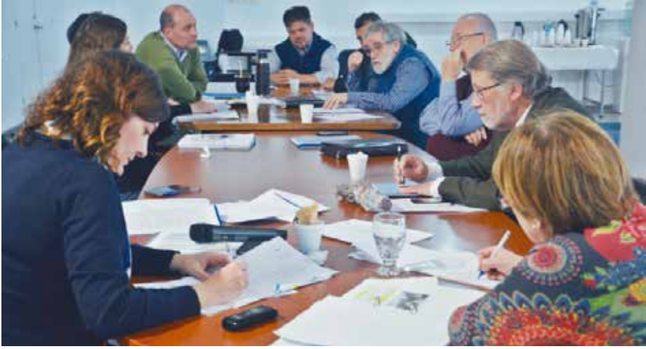
Taller OIT-CONASSAT de 30 de agosto de 2018 para la validación de esta publicación