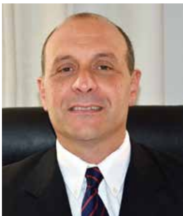
Gerardo Rey. Presidente del CONASSAT desde marzo 2015 hasta la actualidad

Por último, cabe señalar que durante este período y, a diferencia de lo que señalamos en los anteriores, solo se ha dictado una norma sin intervención del CONASSAT. Nos referimos al Decreto N° 143/017, que incluyó en el ámbito de aplicación del Decreto N° 147/012 (Telecentros) a todos los órganos públicos que cuenten con un centro de atención telefónica. Asimismo, en el seno de la Comisión Tripartita del Puerto, se está formulando un proyecto de decreto sobre SST para el puerto.