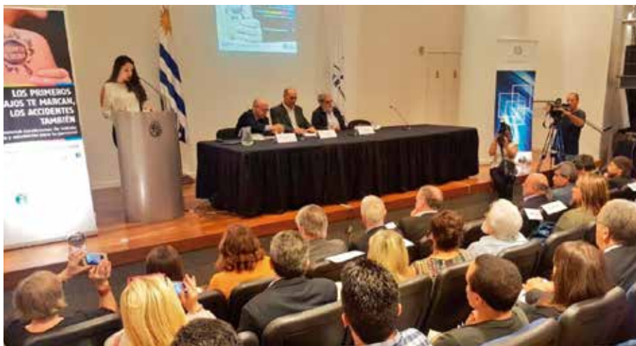
Panel tripartito CONASSAT en evento de presentación de la campaña

La presentación de la campaña tuvo lugar el 27 de abril de 2018, con ocasión del Día Mundial de la Seguridad y la Salud en el Trabajo, en el Salón de Actos de Presidencia de la República. El evento contó con una alta afluencia de público, incluyendo autoridades públicas y de OIT, así como los integrantes del CONASSAT, teniendo lugar un panel tripartito, con tres de ellos, en el que explicaron el proceso de discusión tripartito para llegar a una campaña consensuada.