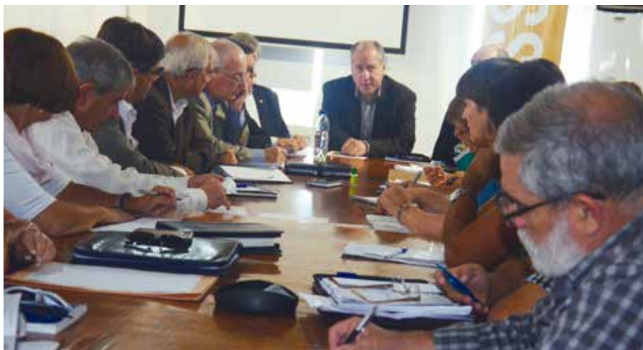
Reunión CONASSAT de 8 de abril 2015 con presencia del Ministro de Trabajo y Seguridad Social

ámbito era un evento muy importante para el MTSS y planteó una agenda abierta con los temas que había mencionado Rey en la reunión con los organismos, agregando que esa agenda debía asociarse a la estrategia principal del MTSS conocida como “Cultura del trabajo para el desarrollo”. El Ministro expresó tener expectativas de que la labor de CONASSAT contribuyera a mejorar la seguridad y salud laboral y propuso como pilares del trabajo “el diálogo, el respeto y la transparencia”.